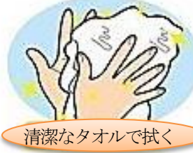
清潔なタオルで拭く

洗しやすい場所はよく洗えるのですが、爪の間など細かいところは忘れがちです。これからどんどん寒くなり、風邪を引きやすい時期になってきます。風邪のウイルスは手を介して、体内に侵入する感染経路があるので、予防のためにも正しい手洗いを!!!!